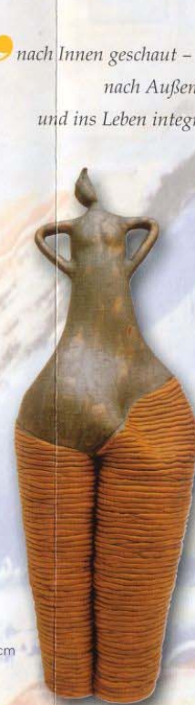
Höhe 65 cm