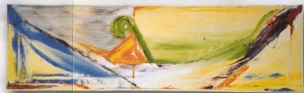
Acryl auf Leinwand, 100 x 30 cm

„nach Innen geschaut - nach Außen gelenkt - und ins Leben integriert“