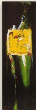
Acryl/Lacke auf Leinwand 30 x 100 cm