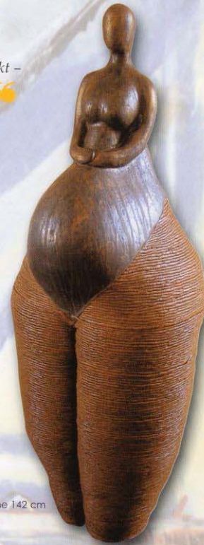
Höhe 142 cm