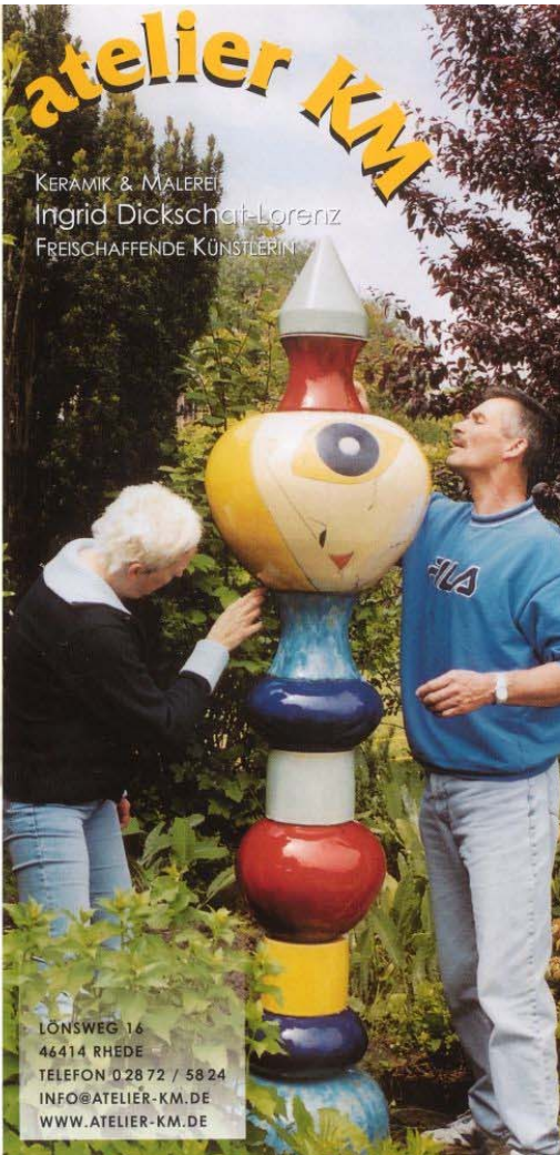
Abb. rechts: Keramiksäule, glasiert und bemalt, frostsicher.

LÖNSWEG 16 46414 RHEDE TELEFON 0 28 72 / 58 24 INFO@ATELIER-KM.DE WWW.ATELIER-KM.DE