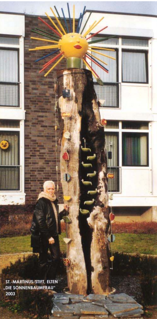
ST. - MARTINUS-STIFT, ELTEN „DIE SONNENBAUMERAU“ 2003