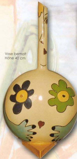
Vase bemalt Höhe 40 cm