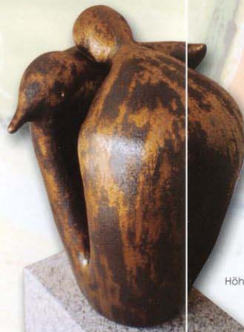
Höhe 62 cm