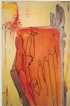
Öl/Lacke auf Leinwand (Ausschnitt) Original 50 x 150 cm