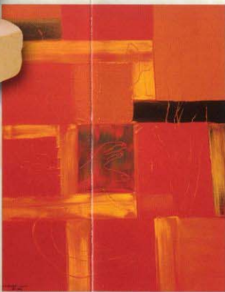
Acryl auf Leinwand, 80 x 100 cm